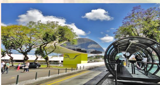
Museu do Olho