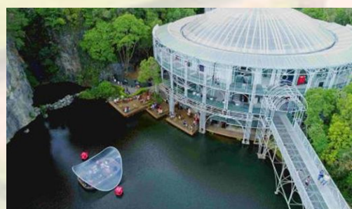
Opera de Arame – Curitiba – PR