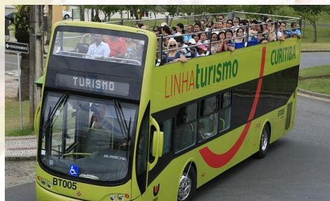
Linha de Turismo – Ônibus Panorâmico de Curitiba