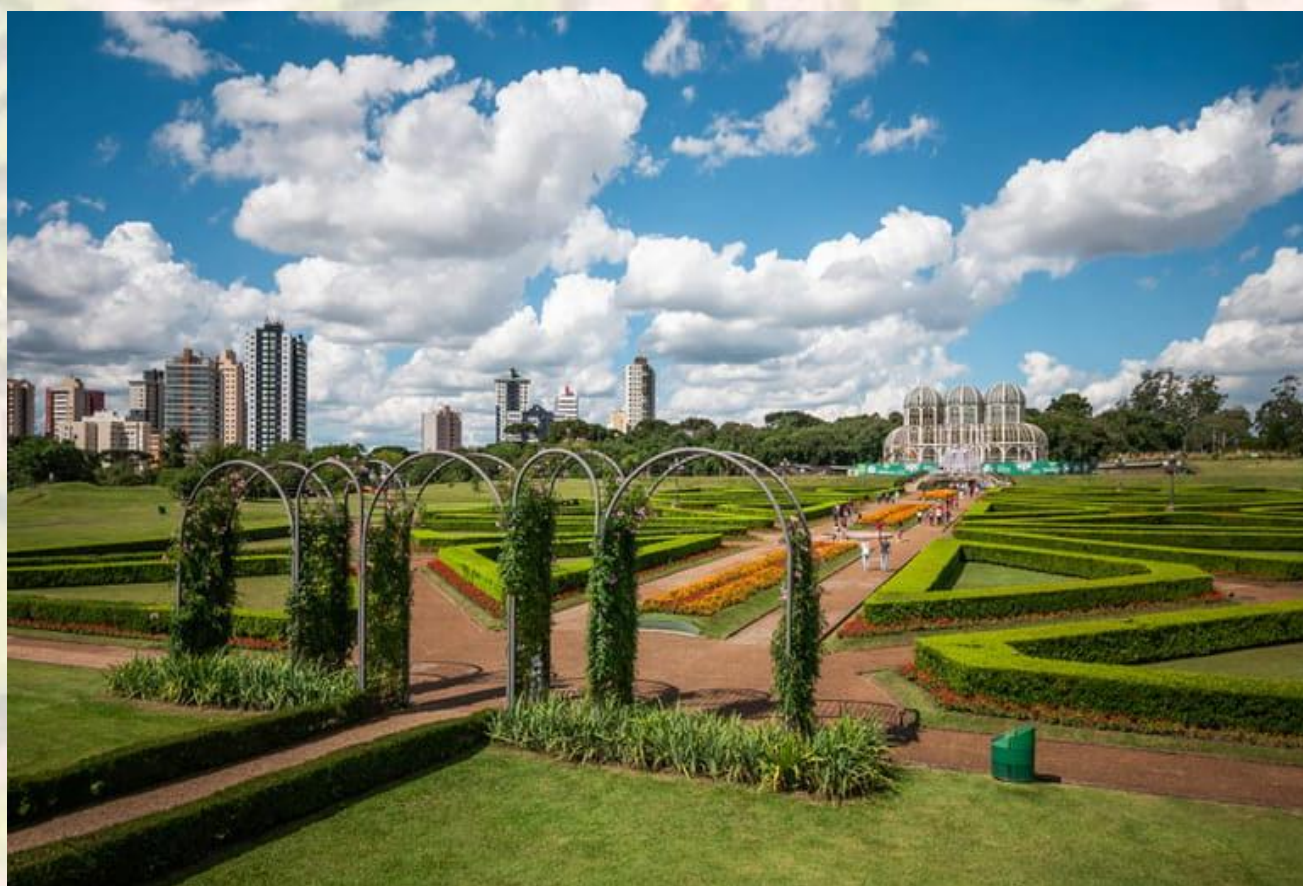
Jardim Botânico – Curitiba – PR